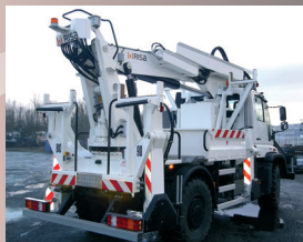
74TA30 sur U530

Porteur Poids lourd 19t Sans accessoires de forage